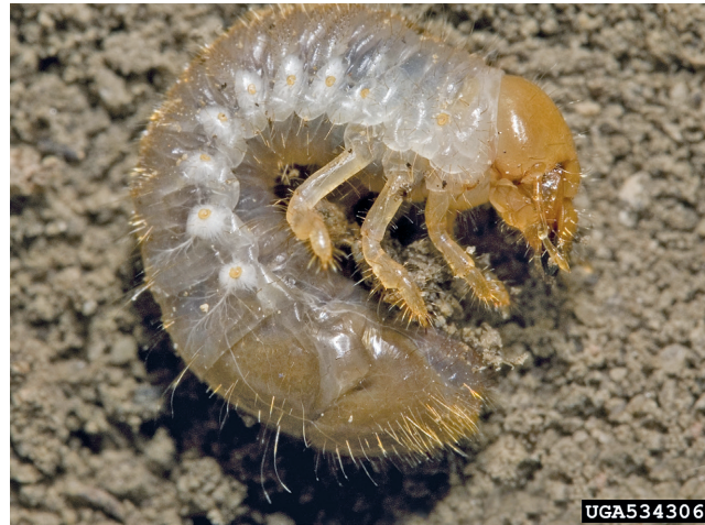
3. Popillia japonica - Larve