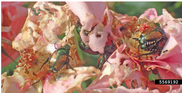
7. Fraßschäden an Rosenblüten

Wie kann das Einschleppen und Verbreiten verhindert werden?