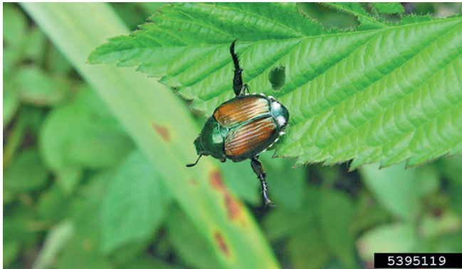
2. Typisches Verhalten des Japankäfers bei Gefahr

Die Engerlinge (Larven) unterscheiden sich von anderen Engerlingen durch v-förmig angeordnete Borsten am hintersten Körpersegment. Die Puppe gleicht der Form nach einem erwachsenen Käfer.