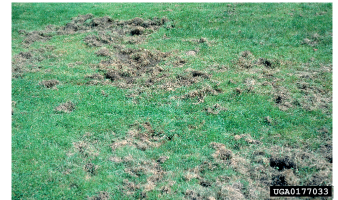
4. Schaden an einer Wiese durch die Larven des Japankäfers

Zierpflanzen: Calluna vulgaris (Heide), Dahlia sp., Aster sp., Zinnia sp. u.a. sowie die Ziergehölze Thuja sp., Syringa sp. (Flieder), Virburnum sp. (Schneeball) u.a.