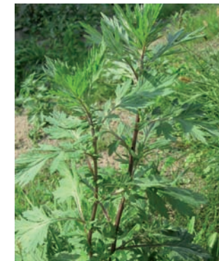
Gemeiner Beifuß ( Artemisia vulgaris )