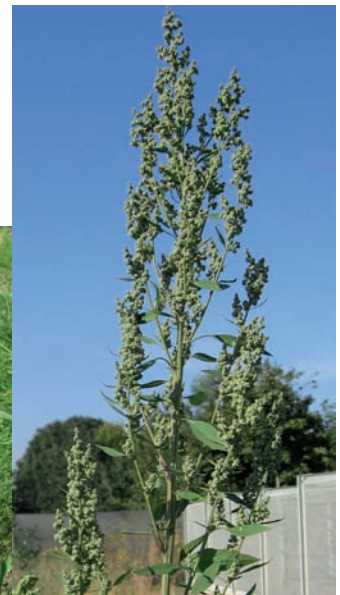
Gänsefuß ( Chenopodium sp.)