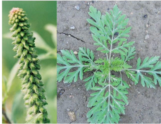
Männlicher Blütenstand der Beifuß-Ambrosie (links) Junge Pflanze mit typischen doppelt fiederteiligen Blättern (rechts)