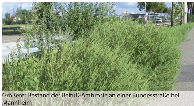
Größerer Bestand der Beifuß-Ambrosie an einer Bundesstraße bei Mannheim