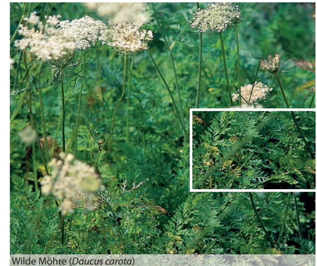
Wilde Möhre ( Daucus carota )