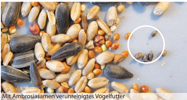
Mit Ambrosiasamen verunreinigtes Vogelfutter