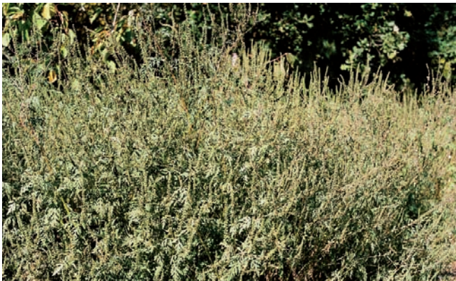
Größerer Bestand blühender Beifuß-Ambrosien

Das hängt u.a. damit zusammen, dass die Pflanze als Ackerunkraut mit Sonnenblumen vergesellschaftet ist.