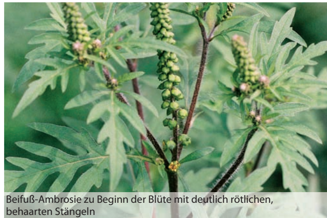
Beifuß-Ambrosie zu Beginn der Blüte mit deutlich rötlichen, behaarten Stängeln