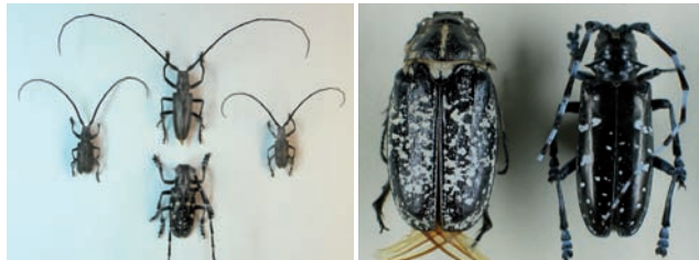
Links: männliche Käfer der drei in Deutschland und Österreich vorkommenden Monochamus -Arten mit ALB (unten Mitte); Rechts: Walker und ALB (rechts).

Eine Verwechslung der erwachsenen Käfer mit heimischen Insekten ist auf Grund ihrer Färbung kaum möglich. Am ähnlichsten sind die Monochamus -Arten M. galloprovincialis , M. sutor und M. sutor , deren Wirtsbäume jedoch Nadelgehölze sind. Ein selten vorkommender, großer schwarzer Käfer mit weißen Zeichnungen auf den Flügeldecken ist der Walker ( Polyphyllo fullo ), der zu den Blatthornkäfern gehört und auf Grund seiner Körperform eher einem Maikäfer ähnelt.