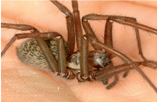
Die Große Winkelspinne - Tegenaria atrica C.L. Koch 1843

Wem es gelingt, die Spinne mit einem Glas und Bierdeckel vorsichtig aufzunehmen und auf freien Fuß zu setzen, der hat sich damit ein Stück der heimischen Natur genähert! (dve)