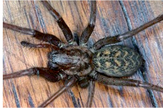
Die Große Winkelspinne - Tegenaria atrica C.L. Koch 1843