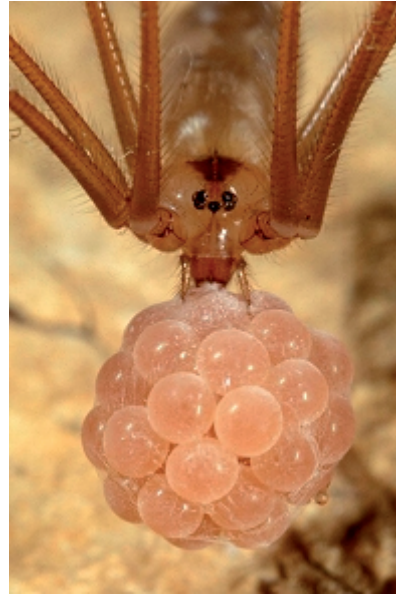
Die zarten Taster des Weibchens halten den Eierkokon. Gut zu sehen sind die acht Augen, die in zwei Gruppen zu dritt und einem Doppelauge in der Mitte aufgeteilt sind.