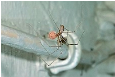
Die Weibchen der Zitterspinnen bewachen etwa zwei Wochen den Eierkokon. In dieser Zeit nehmen sie keine Nahrung zu sich.