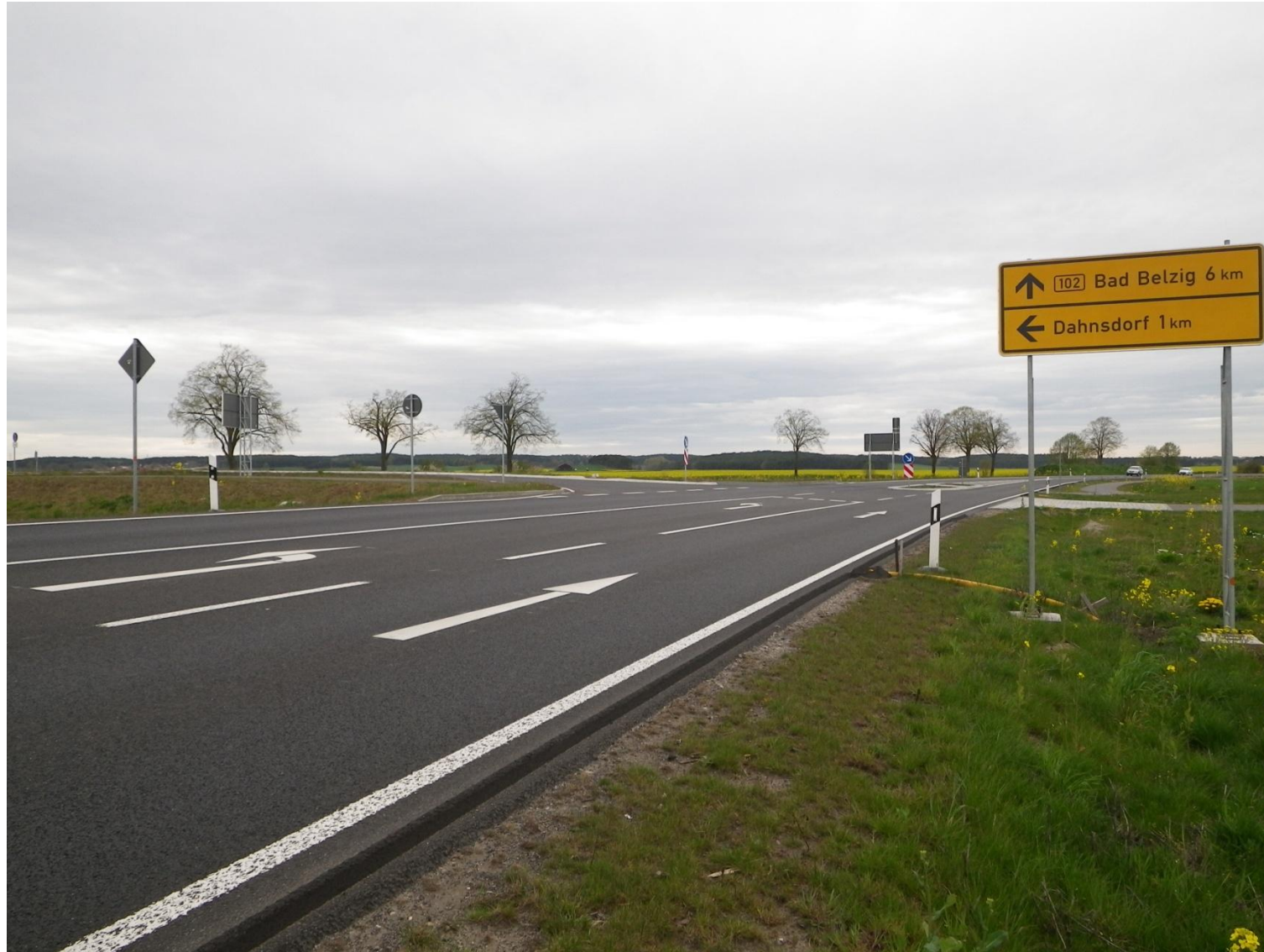
Detailbild Abfahrt 2